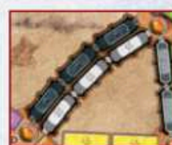
Двойной туннельный перегон (чёрно-белый) между Мадридом и Памплоной.

В тех редких случаях, когда в колоде и в сбросе нет трёх карт, игрок вскрывает все имеющиеся там карты. Если же игроки забрали все карты составов, и их не осталось ни в колоде, ни в сбросе, — туннель проходится без вскрытия карт, как обычный перегон.